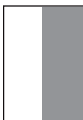
90 x 260 mm