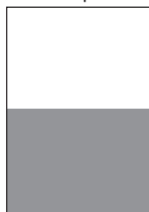
1/2 Seite quer